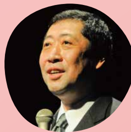
北海道大学 内科II 教授