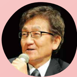
北海道大学名誉教授