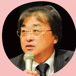
北海道内科リウマチ科病院 理事長